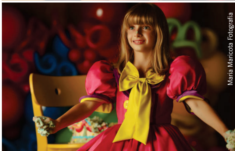
Maria Maricota Fotografia